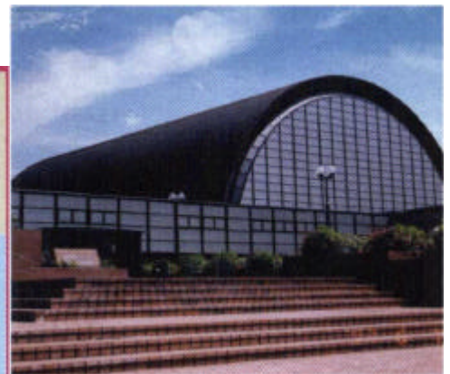
夢の島総合体育館 新木場駅より徒歩10分