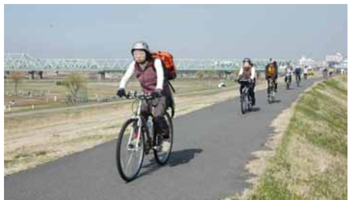
《小貝川サイクリングロードを走る》