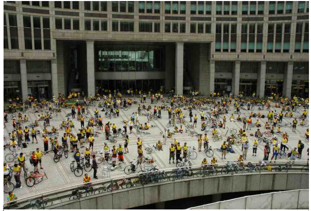
都民広場に集まった参加者たち