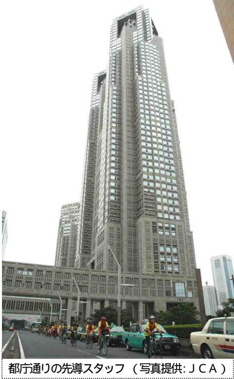
都庁通りの先導スタッフ

ガスの科学館までで道案内は終わり、と勝手に思い込み館内で水を補給し戻るとサービススタッフの女性に「皆さん、捜していましたよ。」と教えられ、すぐに出発。しかし、追いつくはずもないので、ゆっくりゴールを目指す。あとは神宮外苑に行きさえすれば今日の予定は終了と思いきや、銀座4丁目からの迷走が始まりました。スタッフの足りないポイントへ行ったり来たり、最終的には新橋で最終ランナーを見送り、誘導は終了。撤収をしてスタッフ一同神宮外苑を目指す、しかし、張り切り過ぎた私は集団について行けず、ラストゴールとなりました。