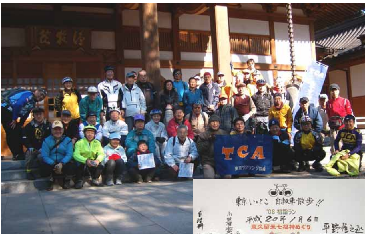
浄牧院(大黒天尊)にて (H20.1.6)

好天に恵まれた1月6日(日)、西武池袋線の東久留米駅東口には、恒例のTCA初詣ランに44名(子供2名を含む)の参加者が集合しました。