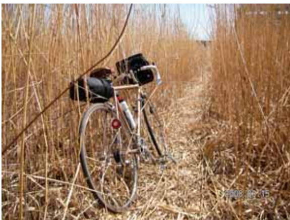
渡良瀬遊水池の葦原

健脚の3人について行ったので、てっきり一周コースかと思いきや、背丈以上の高さのある葦の藪に入ってしまった。途中まで何とか葦と戦いながら