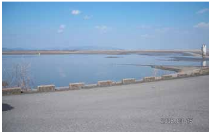
渡良瀬遊水池を望む雄大な景色