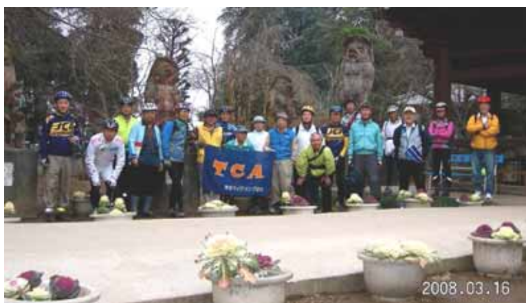
茂林寺の狸をバックに狸親父達が並ぶ

東部伊勢崎線川俣駅前の「川俣事件」の案内板を見て少し歴史の勉強をしてから、利根川の昭和橋を渡り道の駅「羽生」で休憩後、予定していなかった「利根大堰」を見学する