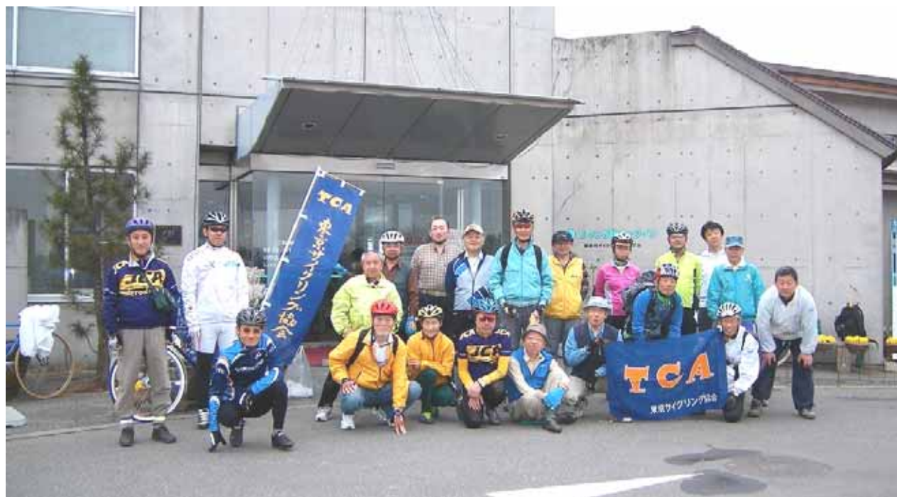
つつじが岡パークイン前にて21人全員で記念撮影（左端が筆者）