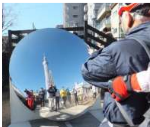
スカイツリーと一緒に撮れるオブジェ