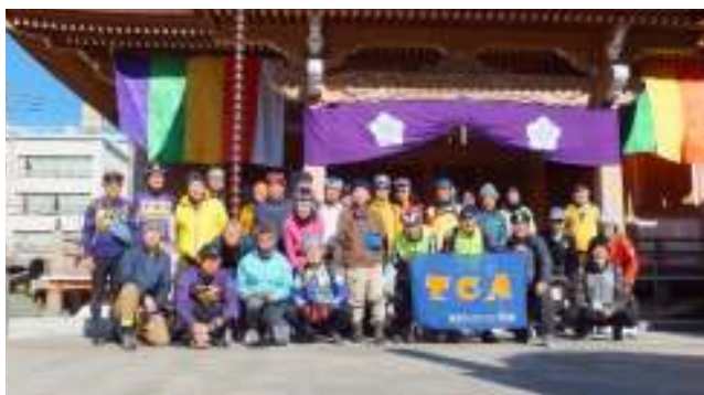
東覚寺にて全員で記念撮影