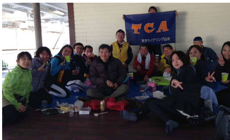
盛り上がった自転車女子との交流

今回ツアーは、TCAによる「第51回関東甲信越ブロック大会」の下見調査を兼ねて企画されました。