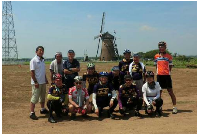
佐倉ふるさと広場の風車と