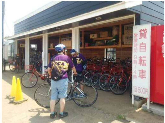
佐倉ふるさと広場の自転車貸出所