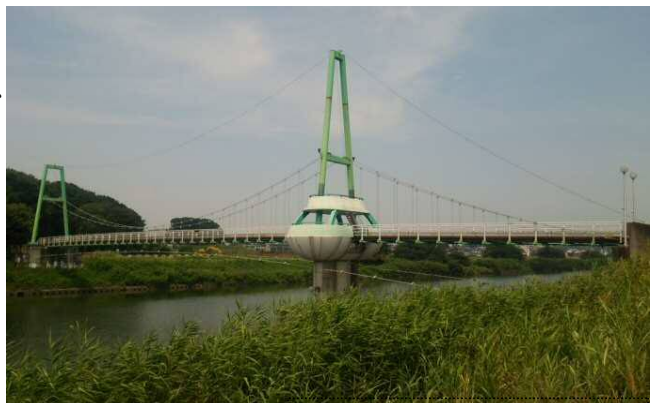
飛行機のように見える橋